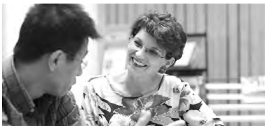
Win-Win-Situation durch echte Kommunikation.

Vom Kurs Gesprächsführung war ich positiv überrascht und konnte Einiges sofort umsetzen. Im Gespräch mit Klienten, Kollegen und Mitmenschen fühle ich mich heute viel sicherer. (Kursteilnehmerin, 2. Jahr)